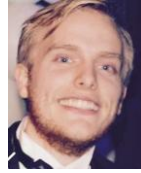
Andreas Schippers Muziek. Rode draad